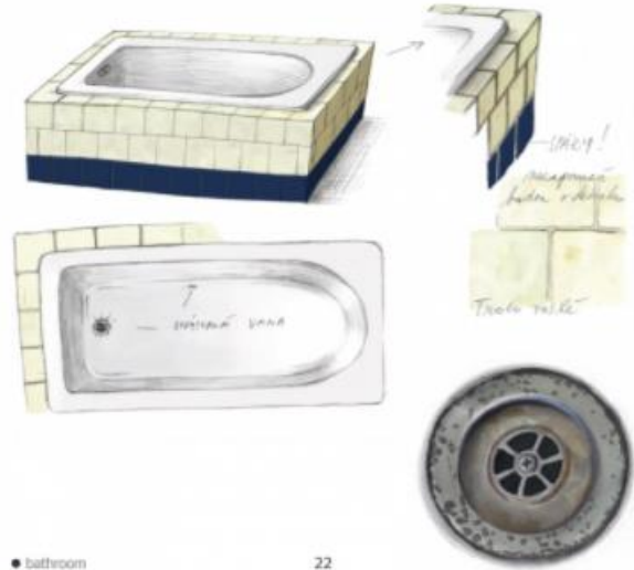
Skica kupaonice iz filma