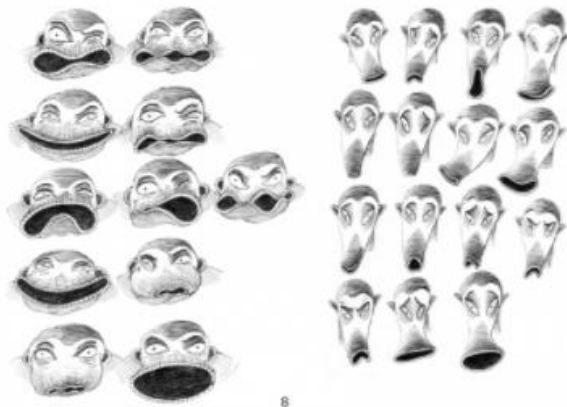
Ekspresije lica likova