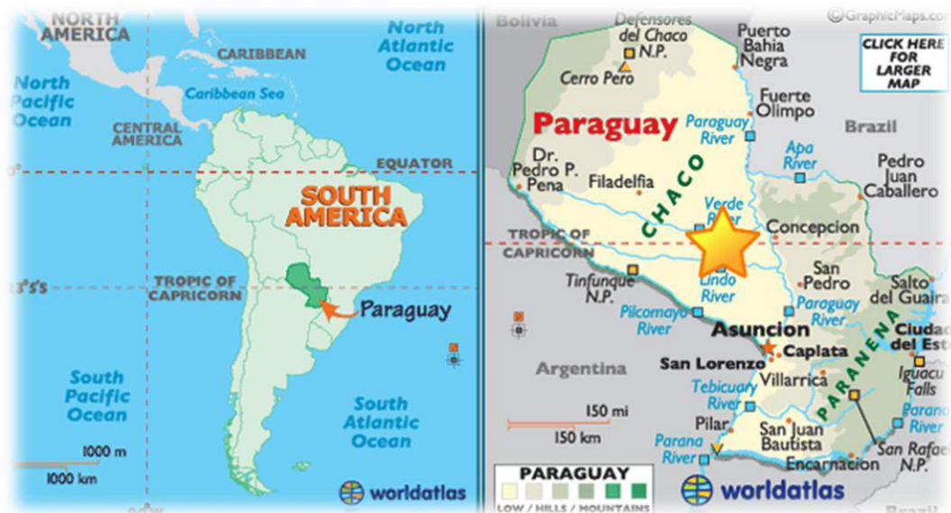
Zemljopisna lokacija Paragvaja i Cateure

koja žive u slamu. Nisu imali novaca za prave instrumente pa su započeli izrađivati instrumente od otpada – violine i violončela od metalnih bačvi, flaute od slavina za vodu, gitare od drvenih paleta. Sa djecom poput Ade i Tanie i podrškom mnogih stanovnika slama, Favio polako osniva jedan od svjetski najpoznatijih orkestara, u kojem je svaki instrument u potpunosti izrađen od otpada.