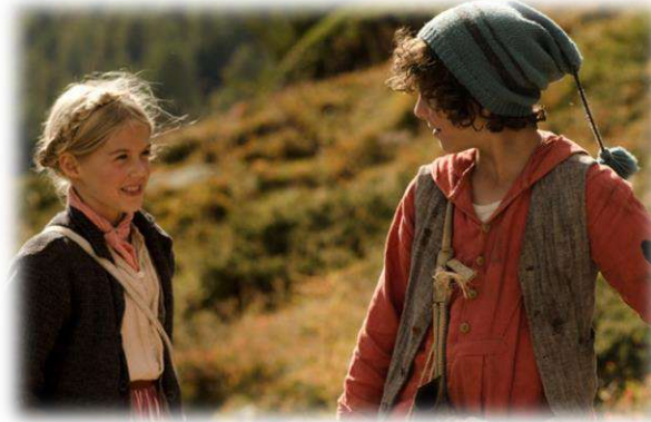
Scene iz filma