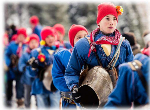
Fotografije sa festivala Chalandamarz

Više fotografija s ove manifestacije možete pogledati na: http://www.lebendige-traditionen.ch/traditionen/00088/index.html?lang=en