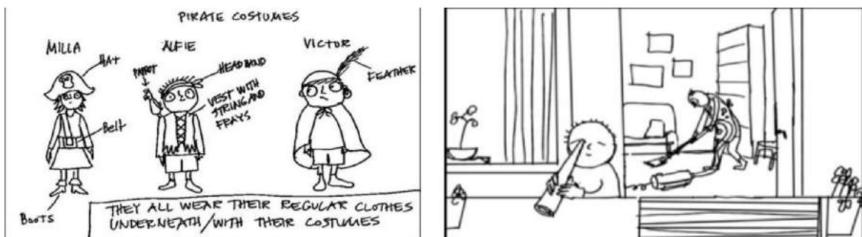
Razvoj likova i storyboarda

Snimljen u norveško-švedskoj koprodukciji, film je napravljen kao klasični 2D crtani film. Scenarij je napisan uz pomoć same autorice knjige, a redateljica je ostala dosljedna originalnim crtežima. Poštovala je izgled popularnog dječjeg lika okrugle glave, velikih očiju, točkastih obrva, raspršene kose, skrpanih hlača i smeđeg džempera, dok neke dijelove filma namjerno nije obojila, već samo nacrtala linije, kako bi što više podsjećale na knjigu. Osim grafičkog stila, boje na filmu su također jednostavne i naknadno dodane računalno. No, Albertu nisu potrebni specijalni i 3D efekti, jer je riječ o sada već bezvremenskom liku i jednostavnoj, toploj priči za koju je i njujorški 'Time Out' rekao da morate pogledati.