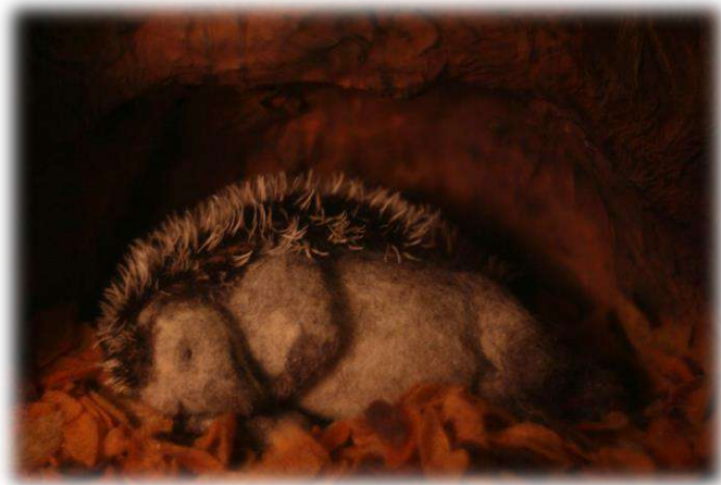
Scena iz filma