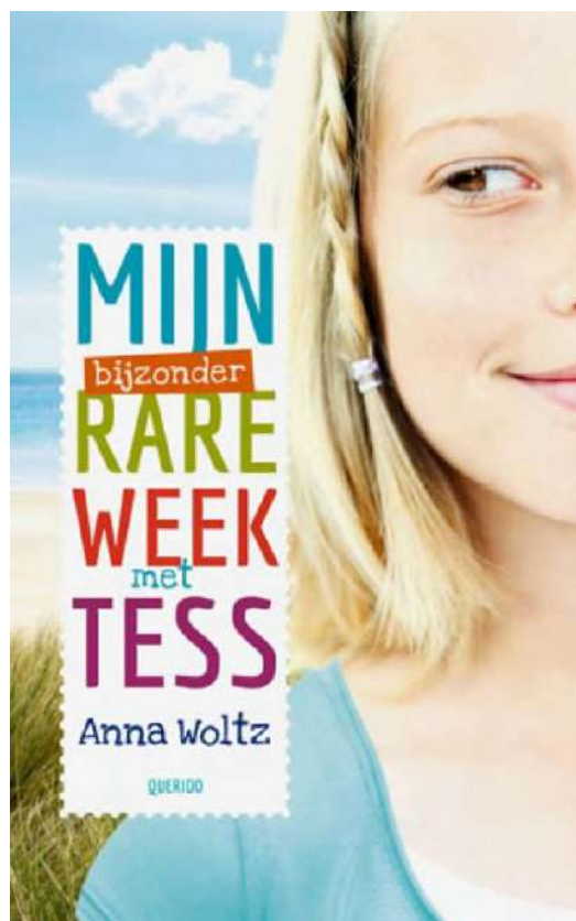
Naslovnica romana "Moj neobični tjedan s Tess"