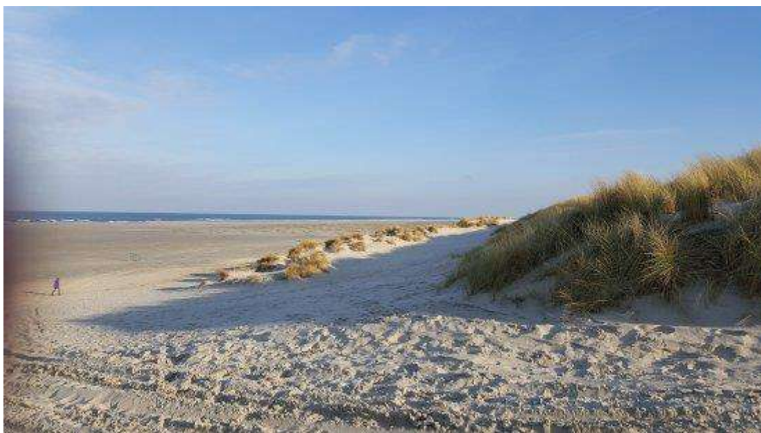
Fotografija otoka preuzeta sa stranice tripadvisor.com

Film je sniman na izvornoj lokaciji, nizozemskom otoku Terschellingu . Ovo otočno mjesto, sa svojim pješčanim dinama, lelujavom trskom i iznenađujuće praznim plažama, čini se bezvremenskim. I sama radnja filma djeluje takva; ona obiluje bezvremenskim dijalozima, likovi mnogo vremena provode na otvorenom, mnogi se mogu poistovjetiti sa situacijama i likovima u filmu, a tehnologija, poput pametnih telefona, prijenosnih računala i Facebooka se spominje i koristi minimalno u filmu.