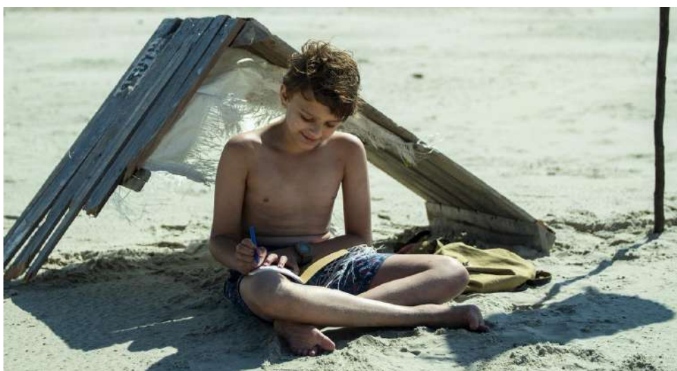
Prizor iz filma